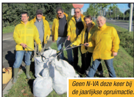
Geen N-VA deze keer bij de jaarlijkse opruimactie. Flauw stadsbestuur!

De N-VA kreeg van het stadsbestuur geen toestemming om mee te helpen bij de jaarlijkse zwerfvuilactie. Twee jaar geleden was dit nochtans geen probleem en namen we de Ringlaan onder handen. Flauw van het stadsbestuur.