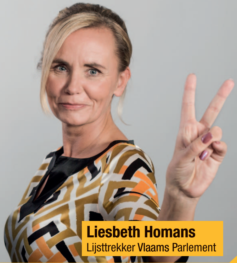
Liesbeth Homans Lijsttrekker Vlaams Parlement

Als burger, als vader en als burgervader zoek ik elke dag oplossingen voor en het welzijn van iedereen die werkt, spaart en onderneemt. Maar zolang we België niet hervormen, staan we machteloos tegenover de hoge belastingen, de faillissementengolf, de verkwistende structuren.