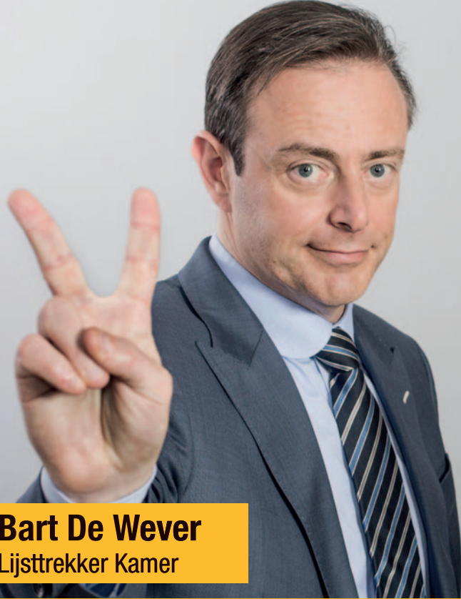
Bart De Wever Lijsttrekker Kamer