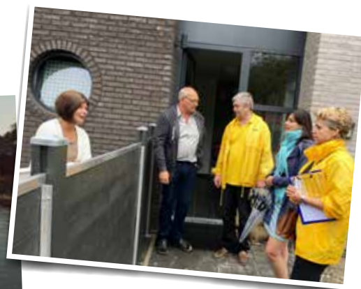
▲ N-VA Herentals bezocht de inwoners van de Markgraven- en Koeterstraat om de waterschade te inventariseren.

Tot op de draad versleten. Zo noemde de Herentalse burgemeester de toestand van de riolering in de Markgravenstraat. De N-VA interpreteert dit als een 'schuldbekenenis'. Het stadsbestuur heeft dan ook de Markgravenstraat en onderliggende riolering zwaar laten verkommeren.