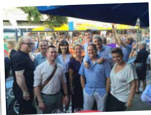
▲ N-VA Herentals was van de partij bij Herentals Fietst en Feest. Een dikke pluim voor iedereen die elk jaar weer dit prachtig volksfeest mogelijk maakt en zo onze stad op de kaart zet.

N-VA Herentals laat zich daarom zien en trekt van wijk tot wijk. We zijn trouwens mee met onze tijd en dus ook bereikbaar op sociale media. Op onze website www.n-va.be/herentals vind je alle contactgegevens.