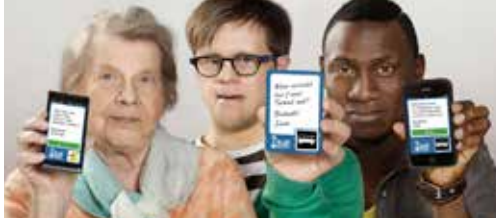
Aandacht voor personen met een beperking p. 2