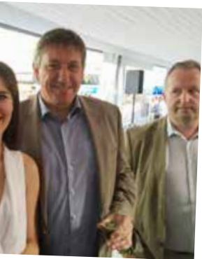
n Jambon gaf het start- s.

Concreet: iemand van Morkhoven die ziek wordt, zou de bus op moeten naar het centrum in Herentals, terwijl die even goedkoop en goed verzorgd zou worden door de huisarts om de hoek.