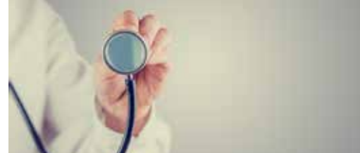
Wijkgezondheidscentrum niet uit startblokken p. 3