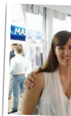
▲ N-VA-minister Ja schot van de koers.