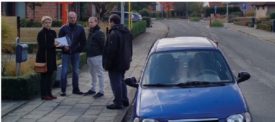
N-VA Herentals bezocht de inwoners van de Wuytsbergen en stelde vast dat negen op de tien inwoners de heraanleg een flop vinden.

Sluipverkeer, snelheidsovertredingen en zwaar verkeer nemen jaar na jaar toe in de Wuytsbergen en Ekelstraat. De ooit rustige wijk is onleefbaar geworden. Daarom werden er boomvakken en parkeerstroken aangelegd. N-VA Herentals hield een rondvraag bij de bewoners, en wat blijkt? Negen op de tien bewoners vinden de opstelling een flop.