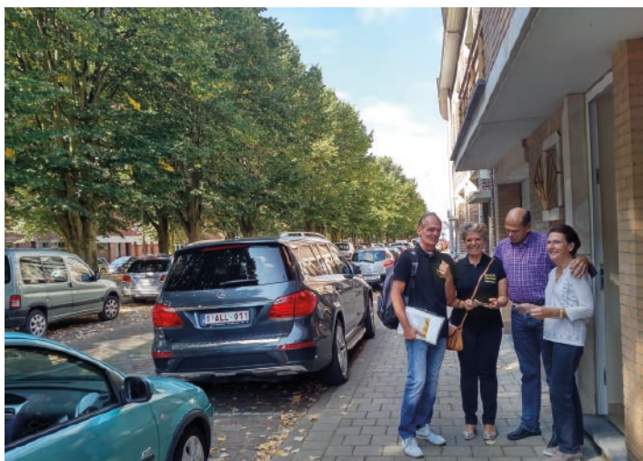
De N-VA vraagt meer aandacht voor deze ooit mooie laan.

Zeven jaar geleden werd de Molenvest heraangelegd. De bewoners vroegen toen om de parkeerdruk te bewaken. Ze waren ook de plannen genegen om schuin te parkeren en zo extra plaatsen te voorzien. Het stadsbestuur legde dit naast zich neer. En met de kunstencampus in het verschiet, zal de parkeerdruk binnenkort nog toenemen.