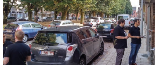
N-VA vraagt aandacht voor Molenvest p.3