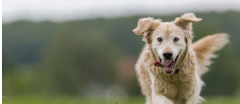
Honden(losloop)weide aan Begijnhof? p.2