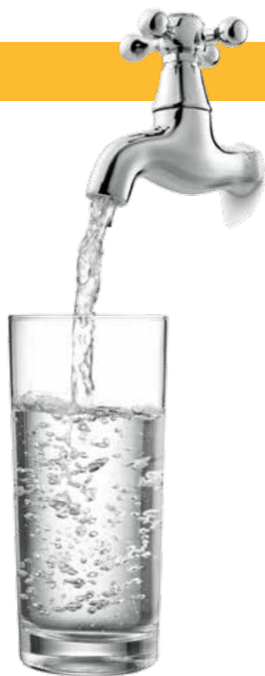
De waterrekening wordt in 2015 zo'n 20 procent duurder.

Nochtans had het stadsbestuur perfect kunnen beslissen om de gemeentelijke bijdrage niet te verhogen. Dit had de stijging van de drinkwaterprijs nog onder controle kunnen houden en de factuur voor de Herentalsenaren kunnen beperken. De N-VA zal er in de toekomst op toezien dat het geld effectief wordt besteed aan het rioolbeheer en niet wordt gebruikt om de rekeningen op te frissen.