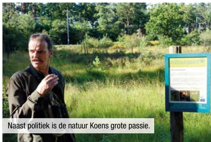
Naast politiek is de natuur Koens grote passie.

Dat zullen er op al die jaren inderdaad wel enkele honderden zijn. Ik ben al heel lang trainer bij de Herentalse turnclub Corpus Sanum. Dat houdt me jong. Ik word nog regelmatig aangesproken door dertigers die ik totaal niet meer herken. Dan blijkt dat ze twintig jaar geleden van mij hun eerste