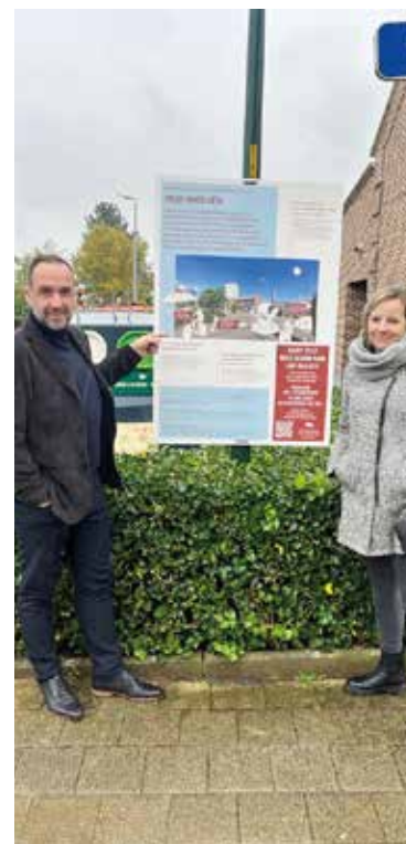
Dit beleidsplan is er geen van het stadsbestuur, maar is er een van ons allemaal.