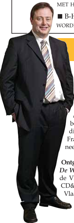
Bart De Wever N-VA-voorzitter

■ OOK DE AANPAK VAN DE VERGRIJZING, HET ACTIVEREN VAN WERKLOZEN, EEN RECHTVAARDIG ASIEL- EN MIGRATIEBELEID ZONDER OPEN GRENZEN, EEN EIGEN VLAAMS JUSTITIE- EN GEZONDHEIDSBELEID,... HET ZAL ALLEMAAL NIET VOOR DIT JAAR ZIJN.