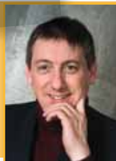
Jan Jambon Kamerlid