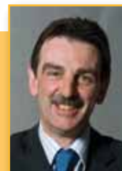
Flor Van Noppen Kamerlid